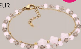
VISANTI GULIA BRACELET