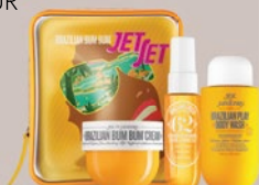
SOL DE JANEIRO BUM BUM JET SET