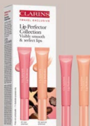
CLARINS LIP PERFECTOR DUO 01 & 02