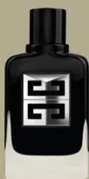
GIVENCHY GENTLEMAN SOCIETY EDP 60 ml