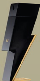
CAROLINA HERRERA BAD BOY EDT 50 ml