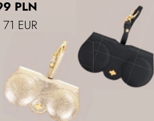
ANY DI SUNCOVER GOLD/BLACK 1 PCE