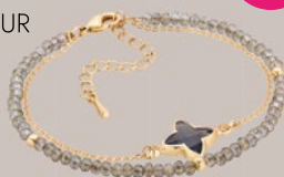
VISANTI VITTORIA BRACELET