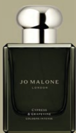
JO MALONE LONDON CYPRESS & GRAPEVINE COLOGNE INTENSE 50 ml