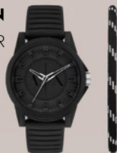
ARMANI EXCHANGE OUTERBANKS GIFT SET WATCH + BRACELET