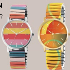
CHOCOMOON HAPPY STRIPES | SUN 1 PCE